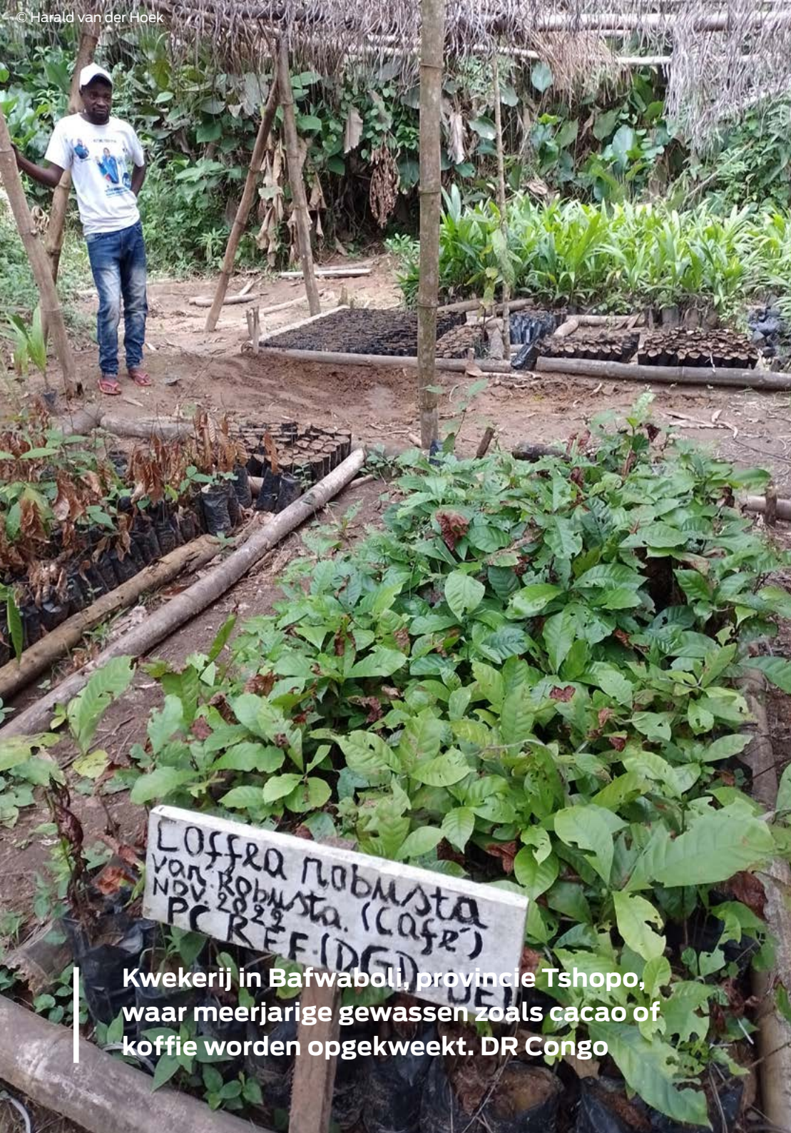
Kwekerij in Bafwaboli, provincie Tshopo, waar meerjarige gewassen zoals cacao of koffie worden opgekweekt. DR Congo