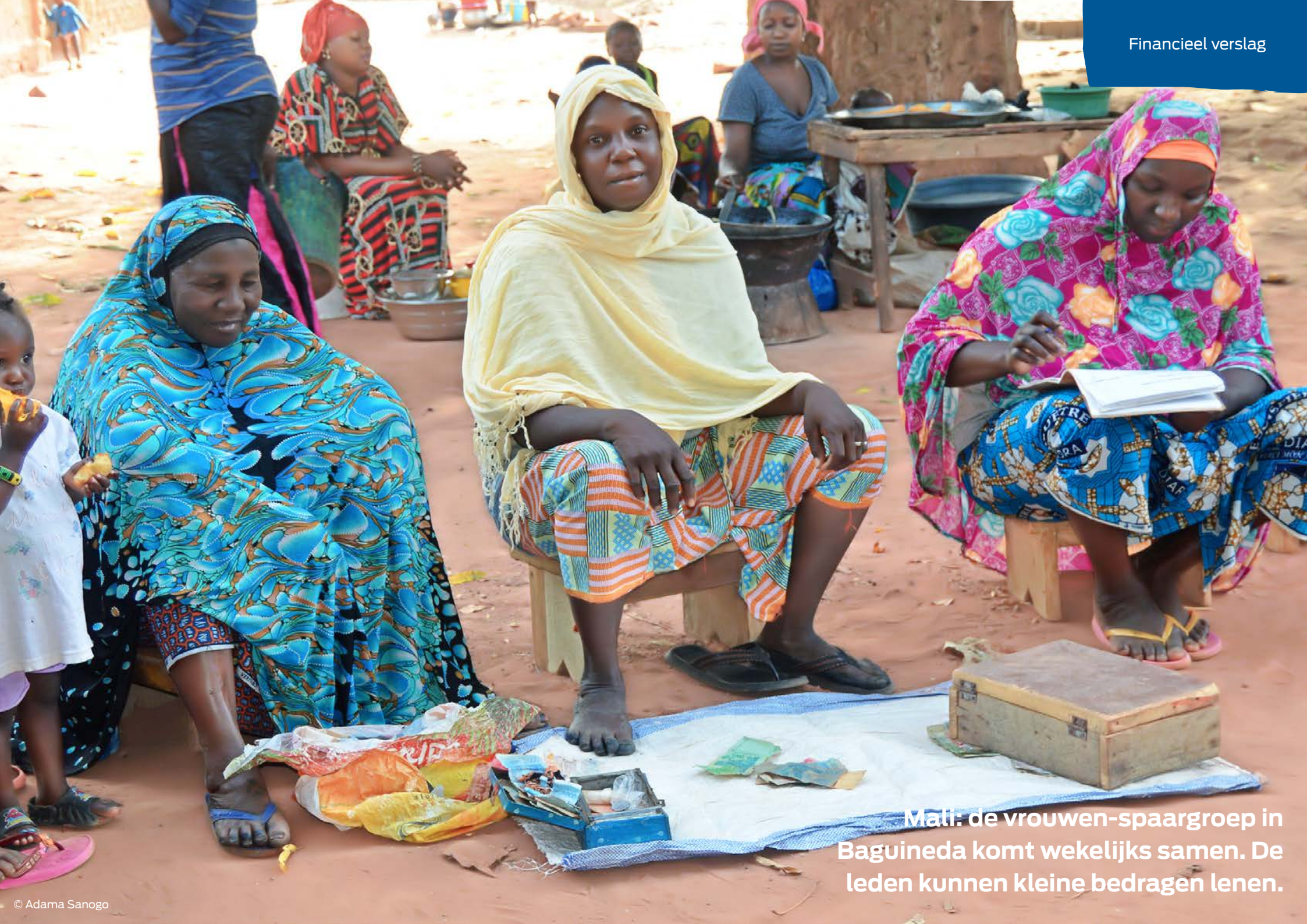
Mali: de vrouwen-spaargroep in Baguineda komt wekelijks samen. De leden kunnen kleine bedragen lenen.