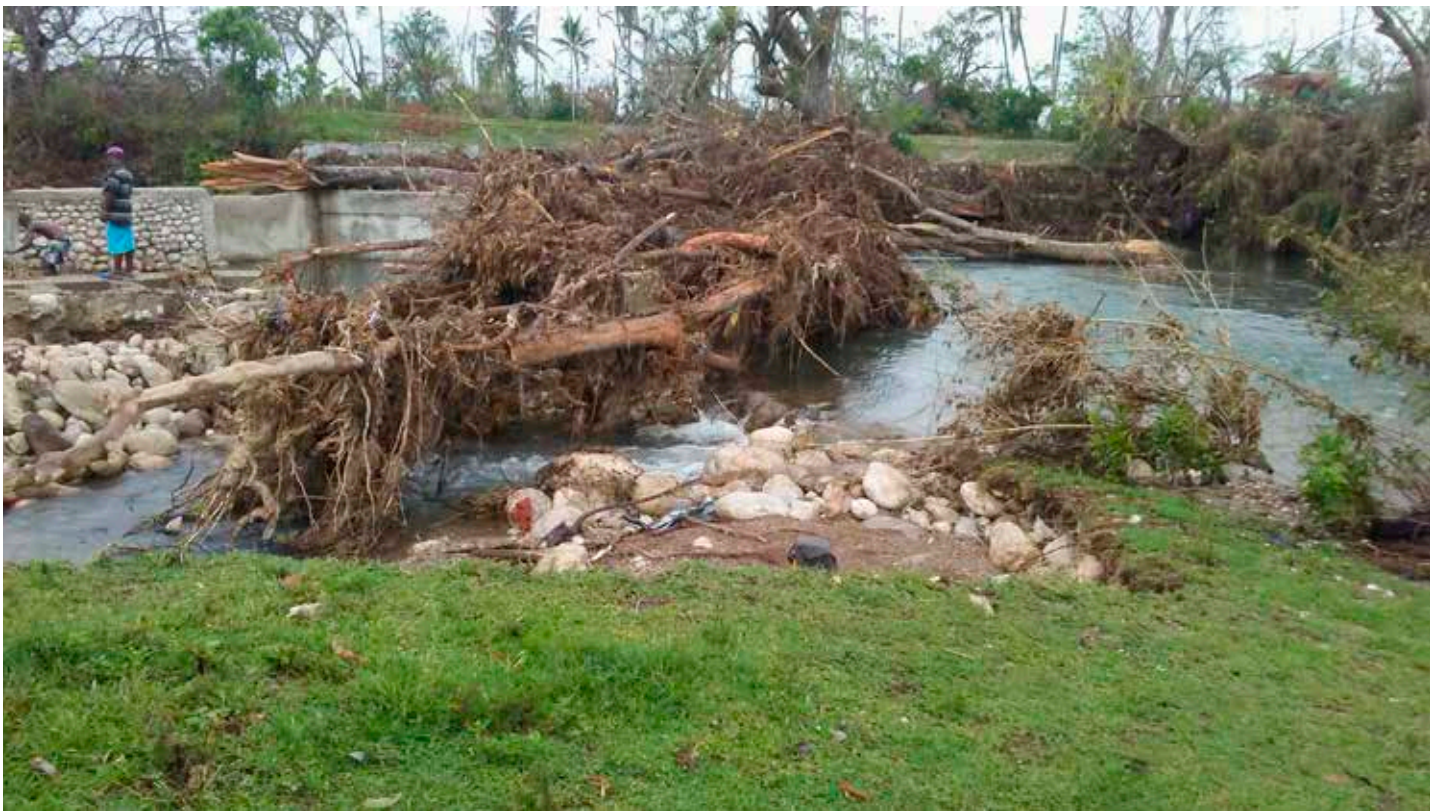
Haiti, na de orkaan Matthew in oktober 2016.

Monique Barbut, UNCCD-directeur, merkt op dat 13% van de mensen die een gebied verlaten, dat doen om redenen van extreme droogte 24 . Of nog, ongeveer 80% van de totale wereldbevolking is reeds onderhevig aan water-onzekerheid (beschikbaarheid t.o.v. vraag, vervuiling) 25 . Een vicieuze cirkel kan ontstaan: “De waterstress kan de reden zijn waarom mensen vluchten, maar kan ook een gevolg zijn van de migratie van groepen mensen, die op hun beurt extra druk leggen op de watervoorziening in de streken waar ze terecht komen” 26 . Deze druk op het water merkt men ook bij interne migraties omwille van klimaatveranderingen. Door de rurale exodus kennen de overbevolkte stedelijke gebieden diverse watergerelateerde problemen zoals waterbevoorrading, kwaliteit van het water, behandeling van het afvalwater, enz.