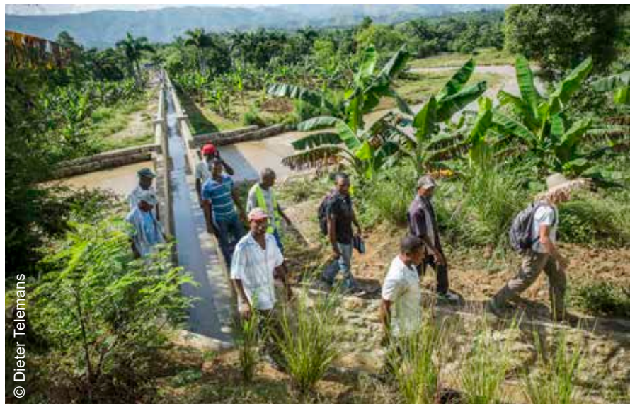
Integraal Water- en Bodembeheer in Belladère-Haïti.